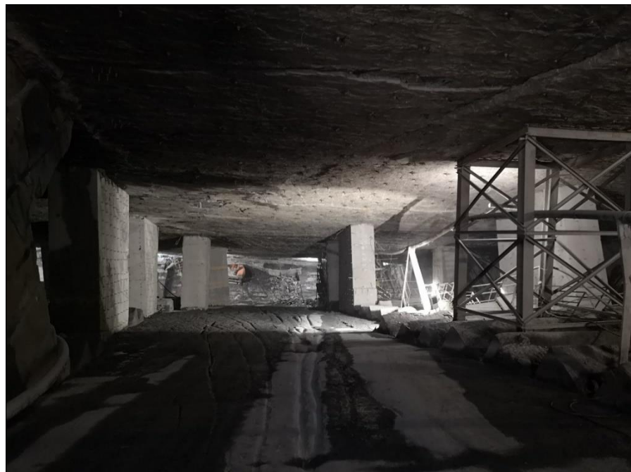
Figure 2. Camere e pilastri di una cava di ardesia

Questa tecnica viene soprannominata "abbattimento per vuoti", poiché vengono lasciati in posto pilastri di materiale utile (o programmati in cemento armato) con certa frequenza o sistematicità. Nel caso dell'ardesia, sono quasi sempre pilastri irregolari e senza una disposizione geometrica precisa e, quindi, la tecnica viene detta a pilastri occasionalmente abbandonati.