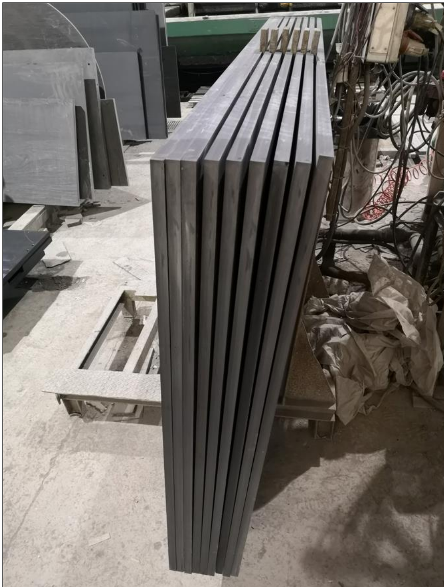
Figure 1. Lastre di ardesia

Nel presente allegato viene descritto il ciclo estrattivo delle cave al fine di produrre delle materie prime commercializzabili costituite da ardesia di diverse forme e dimensioni, come ad esempio il prodotto riportato in Foto 1.